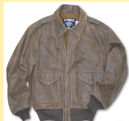
Piel de Cordero A-2 2000 Item: #VA22000 Precio: 292,00€ Color Marrón Vendimia

Realizadas en genuino cuero de cabra, cordero y caballo con las técnicas más refinadas. Se someten a un exhaustivo control de calidad que garantizan la durabilidad de la prenda.