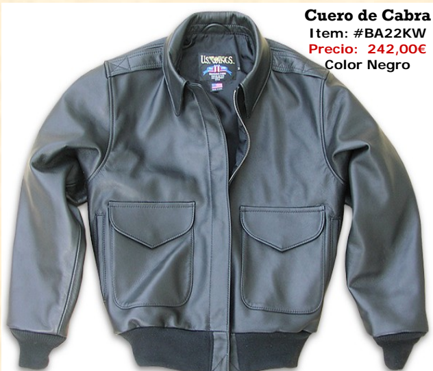
Cuero de Cabra Item: #BA22KW Precio: 242,00€ Color Negro