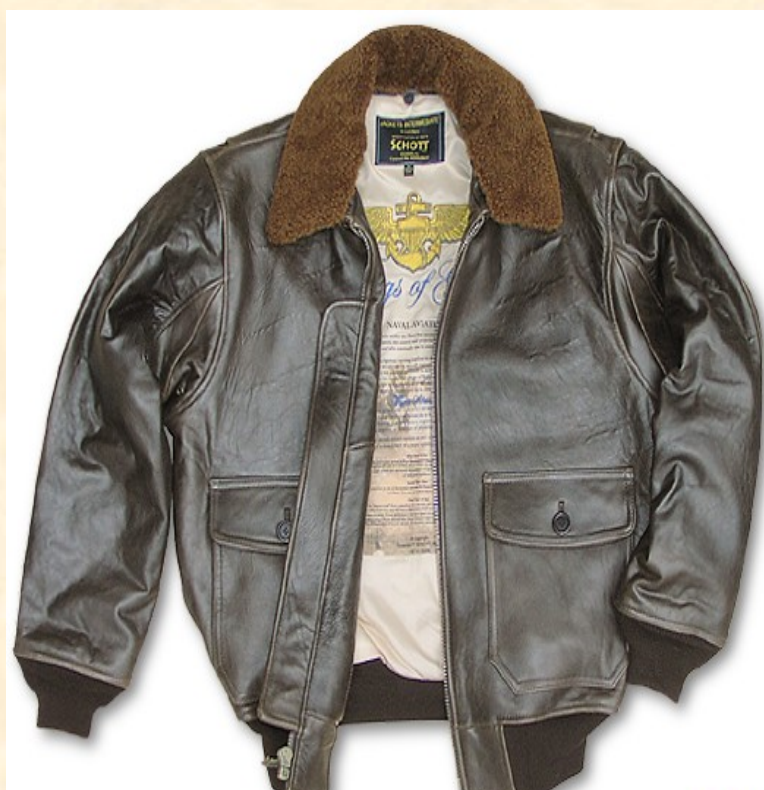
Cuero de Cordero Lambskin antiguo G1 Precio: 370,00€ Item: #WOGG1