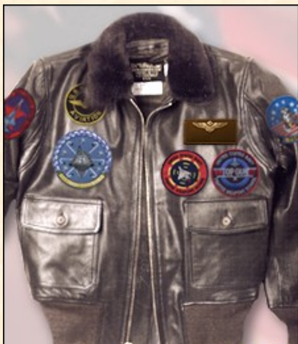
Cuero de Cabra A-2 Precio: 360,00€ Color Marrón Item: #G1TG También recta, tipo chaqueta.