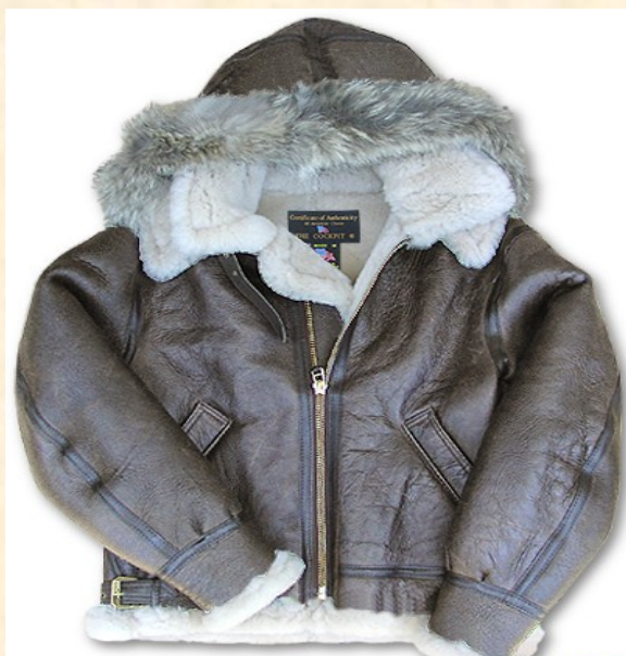
Cuero Lambskin Item: #Z203615 Precio: 680,00€ Color Marrón