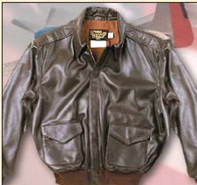
Cuero de Caballo A-2 Precio: 372,00€ Color Marrón Item: #A2H