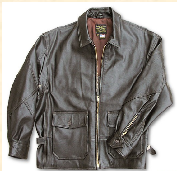
Cuero de Cabra Item: #Z2111W Precio: 420,00€ Color Marrón