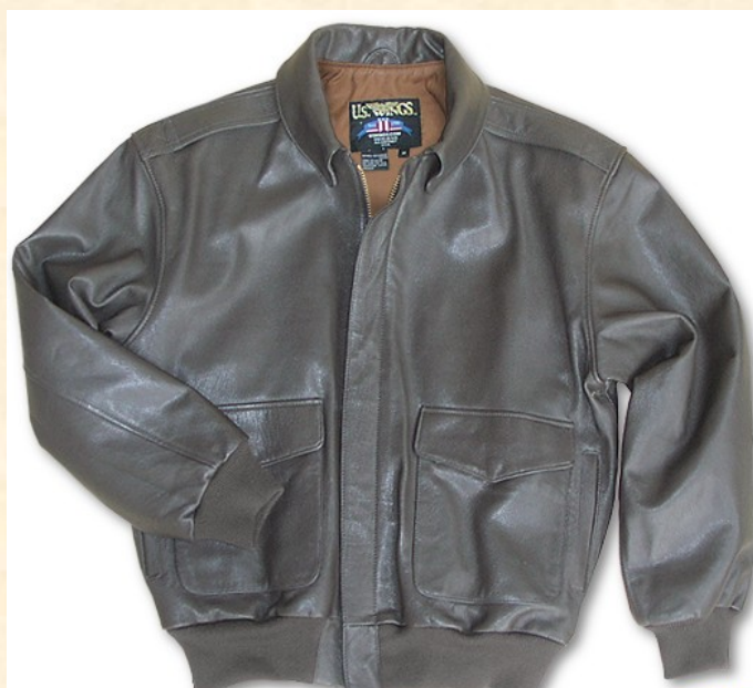
Cuero de Cabra A-2 Precio: 250,00€ Color Marrón Item: #A22000