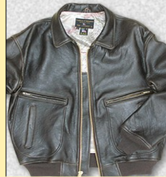
Cuero Lambskin Item: #Z2129A Precio: 380,00€ Color Marrón