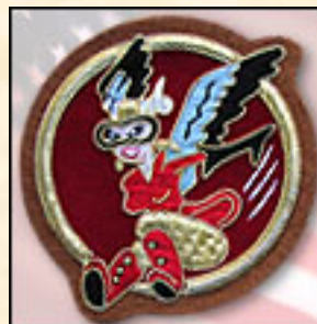
Fifinella Item: #Avispa Precio: 18,00€ Versión bordada en hilo de oro. Insignia de las mujeres piloto