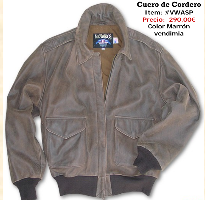
Cuero de Cordero Item: #VWASP Precio: 290,00€ Color Marrón vendimia