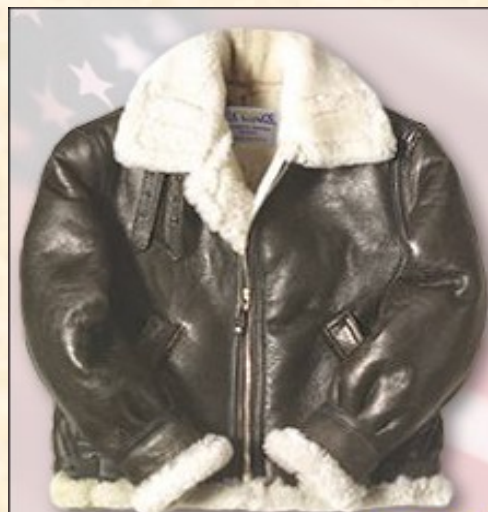
Piel de Cordero Item: #B3R Precio: 510,00€ Color Marrón