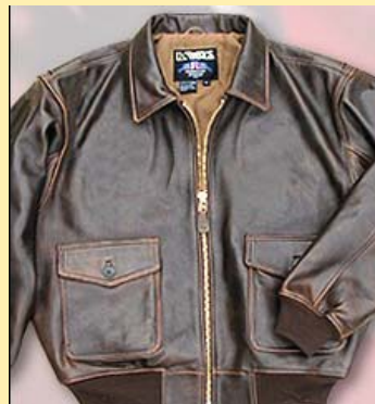
Lambskin A-2 Antigua Precio: 312,00€ Color Marrón Vendimia Item: #ALG2