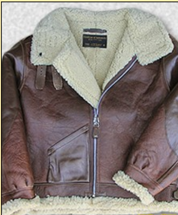
Cuero Lambskin Item: #Z213374 Precio: 750,00€ Color Marrón—Granate