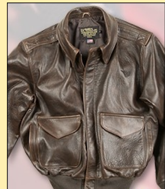
Lambskin A-2 Antigua Precio: 320,00€ Color Marrón Vendimia Item: #A2L