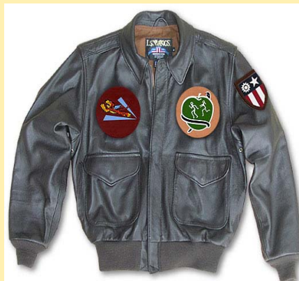
Cuero de Caballo Tigre A-2 Precio: 650,00€ Color Marrón Item: #FTA2AE