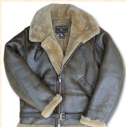
Cuero Lambskin Item: #Z2109 Precio: 585,00€