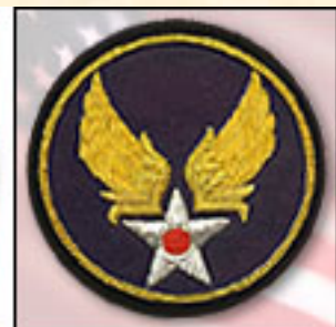
Item: #PB03 Precio: 18,00€ Versión bordada en hilo de oro.