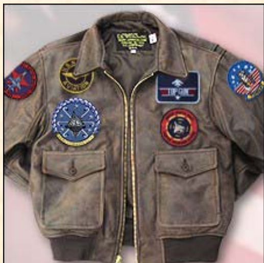
Cuero Cordero Item: #VTGG2 Precio: 450,00€ Color Marrón