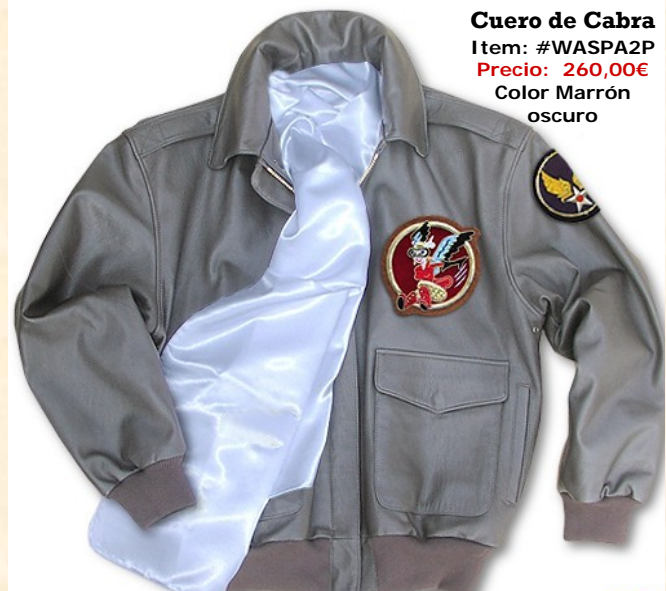
Cuero de Cabra Item: #WASPA2P Precio: 260,00€ Color Marrón oscuro