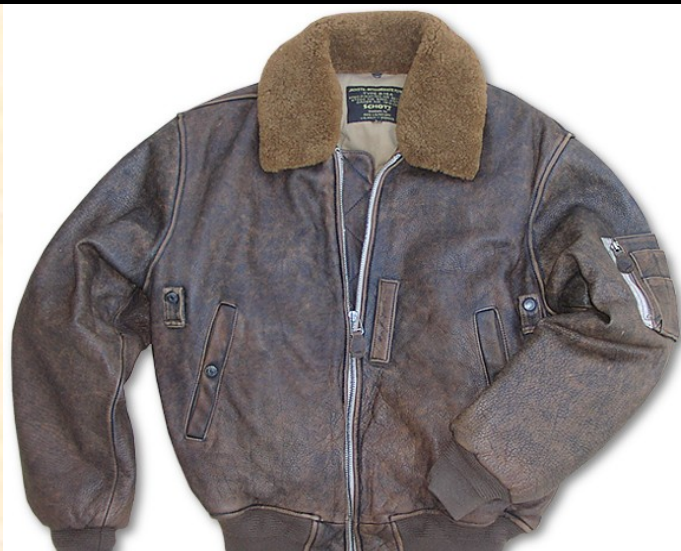
Cuero Cordero Item: #B15VN Precio: 380,00€ Color Marrón vendimia