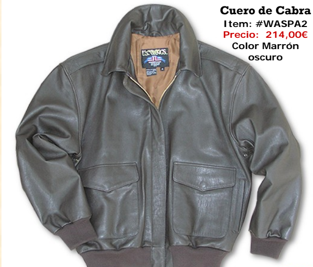
Cuero de Cabra Item: #WASPA2 Precio: 214,00€ Color Marrón oscuro