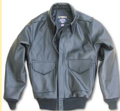
Piel de Cabra A-2 Precio: 225,00€ Color Negro Item: #BA22K