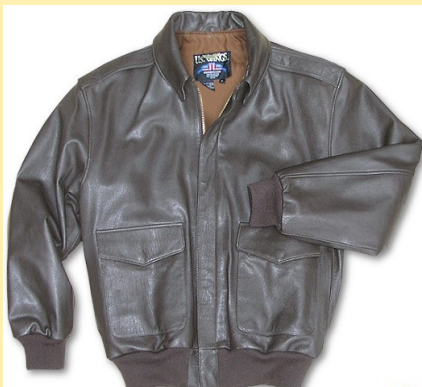
Piel de Cabra A-2 Precio: 225,00€ Color Marrón Item: #A2G