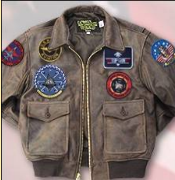
Cuero Cordero Item: #VTGG2 Precio: 450,00€ Color Marrón